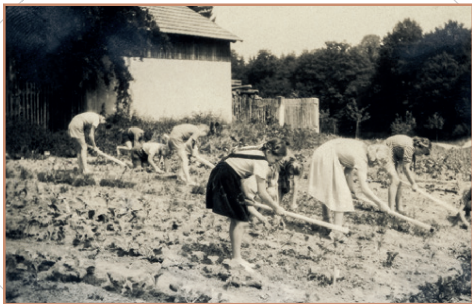
Práce žákyň na „mičurinském“ poli (školní rok 1953/1954)

Novou školu v Přáslavicích navštěvovalo počátkem 20. století v průměru 150 dětí ročně. Jejich řady nepatrně prořídly až po první světové válce. Takový počet vyžadoval zvýšení kapacity, ale do plánované přístavby třetí třídy zasáhla červencová mobilizace v roce 1914. Pomíneme-li světové dění a střídání režimů, ubíhala následující desetiletí ve školních škamnách bez dramatických zvrátů. Velmi potřebná se jevila pouze oprava školy a některé hlasy dokonce požadovaly výstavbu