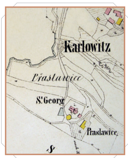
Výřez z vodní mapy z roku 1843 představuje areál kostela s polygonální zvonící a márníci. Školní budova naproti už tehdy žáky navštěvována nebyla.

Nejstarší doklady o kostele si představíme v jiné kapitole. Připomeňme si ovšem, že sahají do poloviny 14. století. Po opuštění osady, možná však až v posled-