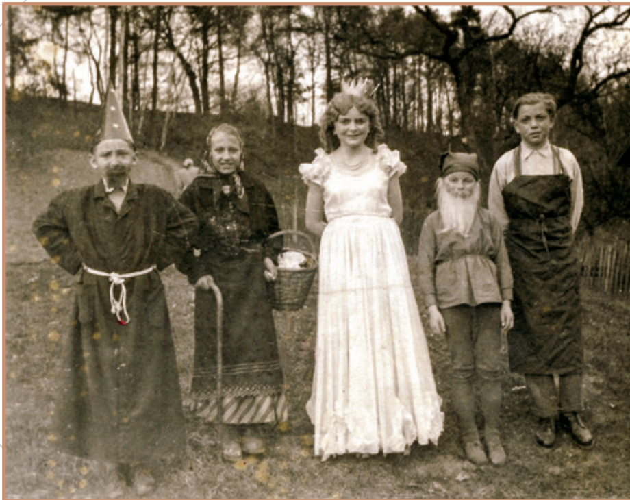
Ze školního představení Slavný mistr Kopřiva (školní rok 1953/1954)

úplně nové budovy. Přestavbu ovšem brzdilo rozhodnutí zemské školní rady, které neváhalo zrušit pobočku při druhé třídě, když v ní počet dětí klesl pod 75. O prázdninách 1923 bylo proto provedeno turnovskou firmou Salač-Kovář nákladem 8578,64 K alespoň základní ošetření. Škola byla nabílena, vyměněny podlahy, odvodněno zdivo a opraveny komíny. O dva roky později přibyla nová střecha.